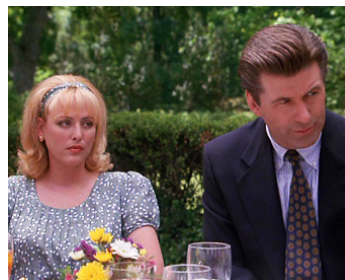
1996 LES FANTÔMES DU PASSÉ (Ghosts of Mississippi) de Rob Reiner avec Alec Baldwin