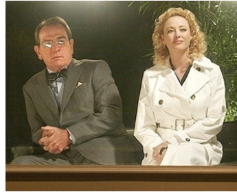
2006 THE LAST SHOW (The last Show) de Robert Altman avec Tommy Lee Jones