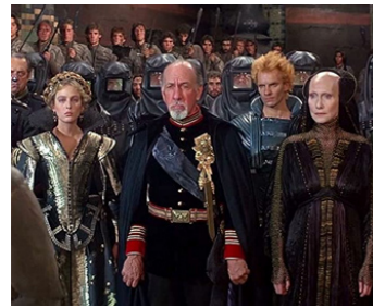
1984 DUNE (Dune) de David Lynch avec José Ferrer, Sting, Sian Phillips