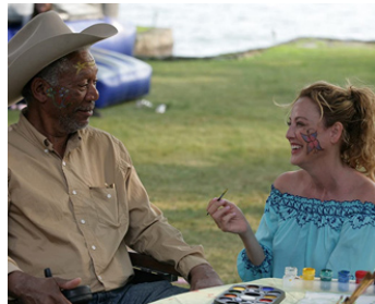
2012 UN ÉTÉ MAGIQUE (The Magic of Belle Isle) de Rob Reiner avec Morgan Freeman