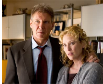
2006 FIREWALL, LE COUPE-FEU (Firewall) de Richard Loncraine avec Harrison Ford