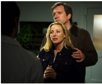
1999 HANTISE (The Haunting) de Jan De Bont avec Martin Donovan