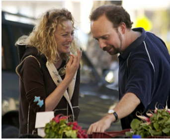
2004 SIDEWAYS, À LA DÉRIVE (Sideways) d'Alexander Payne avec Paul Giamatti