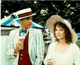
1988 MR NORTH (Mr North) de Danny Huston avec Anthony Edwards