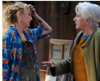
2013 THE LAST KEEPERS de Maggie Greenwald avec Olympia Dukakis