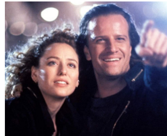
1991 HIGHLANDER, LE RETOUR (Highlander, the Quickening) de R. Mulcahy avec Ch. Lambert