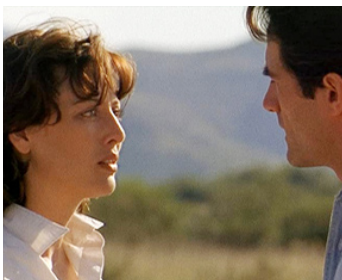
1995 LA PROPHÉTIE (The Prophecy) de Gregory Widen avec Elias Koteas