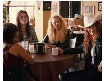
2013 THE HOT FLASHES de Susan Seidelman avec Brooke Shields, Daryl Hannah