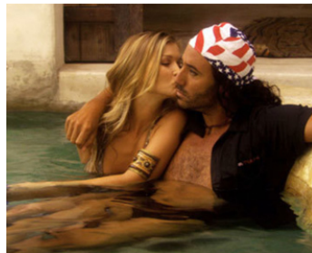
2007 RIPPLE EFFECT de Philippe Caland avec Philippe Caland