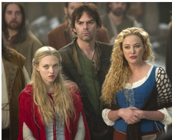
2011 LE CHAPERON ROUGE (Red Riding Hood) de C. Hardwicke avec A. Seyfried, Billy Burke