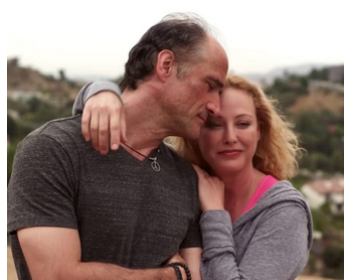
2013 JAKE SQUARED d'Howard Goldberg avec Elias Koteas