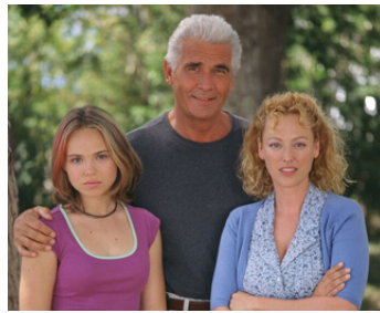
2000 UN MONDE À PART (Children of Fortune) de Sheldon Larry avec Amanda Fuller, J. Brolin