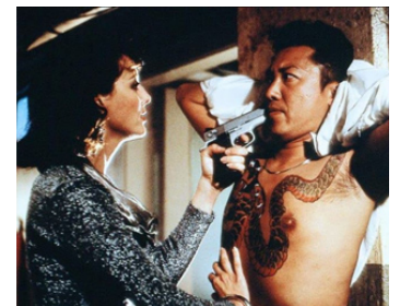
1994 SOUS LE SIGNE DU TIGRE (Blue Tiger) de Norberto Barba avec Ryo Ishibashi