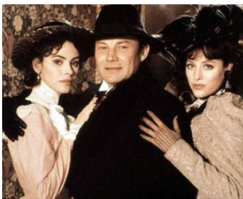
1991 DEVENIR COLETTE (Becoming Colette) de D. Huston avec M. May, K. M. Brandauer