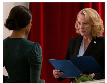
2020 UN NOËL TOMBÉ DU CIEL (Operation Christmas Drop) de M. Wood avec Erica Miller