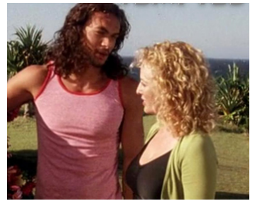
2003 UNE DERNIÈRE VOLONTÉ (Tempted) de Maggie Greenwald avec Jason Momoa