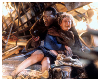
1992 CANDYMAN (Candyman) de Bernard Rose avec Tony Todd