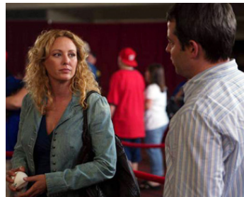
2008 DIMINISHED CAPACITY de Terry Kinney avec Matthew Broderick