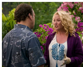
2017 A CHANGE OF HEART de Kenny Ortega avec Jim Belushi