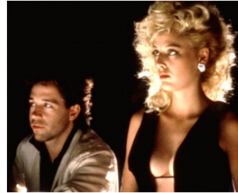
1987 SLAM DANCE (Slam Dance) de Wayne Wang avec Tom Hulce