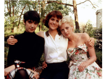
1989 LES ANNÉES COPAIN (Heart of Dixie) de M. Davidson avec Ally Sheedy, Phoebe Cates