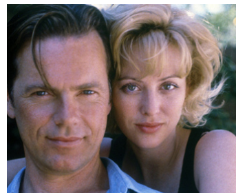
1994 DÉSIR DE VENGEANCE (Bitter Vengeance) de Stuart Cooper avec Bruce Greenwood