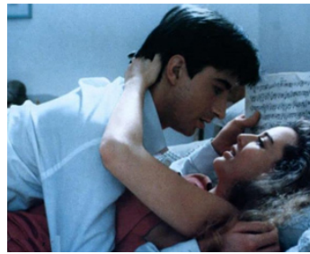
1984 LA BELLE ET L'ORDINATEUR (Electric Dreams) de Steve Barron avec Lenny von Dohlen