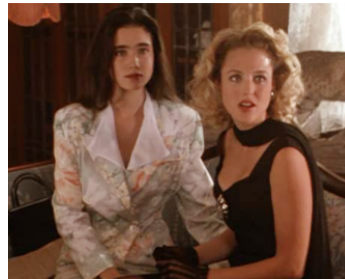
1990 HOT SPOT (The Hot Spot) de Dennis Hopper avec Jennifer Connelly