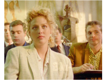
1987 ZOMBIE HIGH (Zombie High) de Ron Link avec Richard Cox