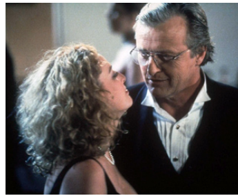
2000 FATAL (Lying in Wait) de D. Shone Kirkpatrick avec Rutger Hauer