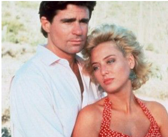
1989 SÉDUCTION RAPPROCHÉE (Third Degree Burn) de R. Spottiswoode avec Treat Williams