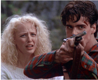
1986 FIRE WITH FIRE de Duncan Gibbins avec Craig Sheffer