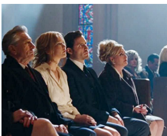
2015 JOY (Joy) de David O. Russell avec Robert De Niro, Jennifer Lawrence, Edgar Ramirez