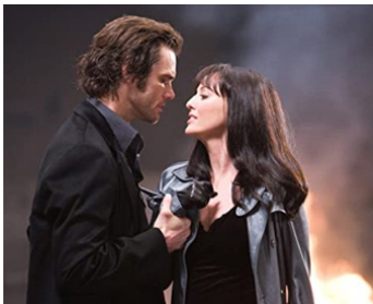
2007 LE NOMBRE 23 (The Number 23) de Joel Schumacher avec Jim Carrey