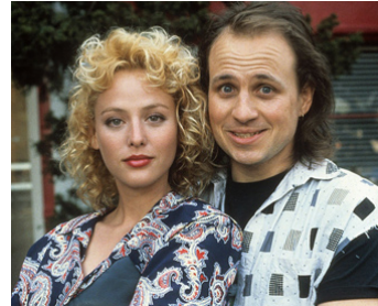
1988 HOT TO TROT (Hot to Trot) de Michael Dinner avec Bobcat Goldthwait