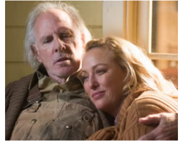
2006 THE ASTRONAUT FARMER de Michael Polish avec Bruce Dern